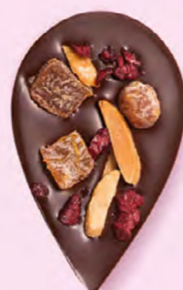
JULIETTE & TOM Chocolat noir 60% de cacao, dés d'abricots secs, amandes caramélisées et morceaux de cerise