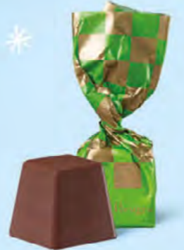
CHOCOLAT NOIR Praliné façon rocher aux éclats de noisettes