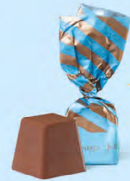
CHOCOLAT AU LAIT Praliné et sucre pétillant