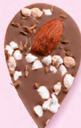
LE SONGE DE JULIETTE Chocolat au lait 35% de cacao, amande, éclats de nougat, brins d'anis