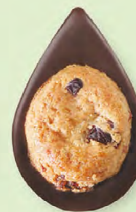
BISCUIT CRANBERRIES Chocolat noir 60% de cacao