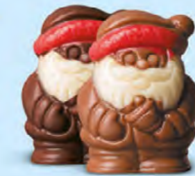
Duo praliné et caramel ou praliné et éclats de noisettes caramélisées