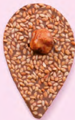
GRAINE DE JULIETTE Chocolat au lait 35% de cacao, sésame, noisette caramélisée