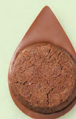
BISCUIT BROWNIE Chocolat au lait 35% de cacao

Les prix barrés sont les prix de vente TTC maximum en boutique. *Prix de vente TTC maximum.