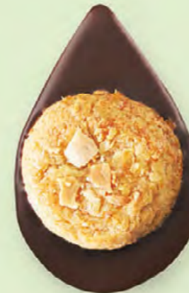
BISCUIT AMANDES Chocolat noir 60% de cacao