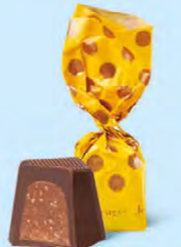
CHOCOLAT NOIR Praliné avec éclats de crêpe dentelle

BOITE DE 245 G NET 19 SUJETS ASSORTIS AU PRALINÉ 7 RECETTES