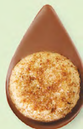
BISCUIT NOISETTES Chocolat au lait 35% de cacao

Un biscuit sablé artisanal posé sur un très bon chocolat ! C'est simple et c'est divin.