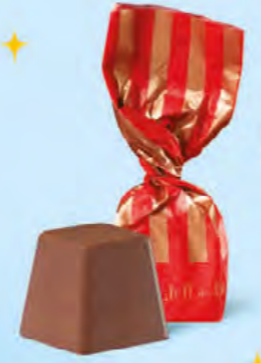
CHOCOLAT AU LAIT Praliné noisettes façon pâte à tartiner