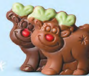
Praliné et éclats de noisettes torrifiées ou praliné et éclats de crêpe dentelle