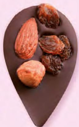
JULIETTE IN THE CITY Chocolat noir 60% de cacao, amande, noisette, raisins secs