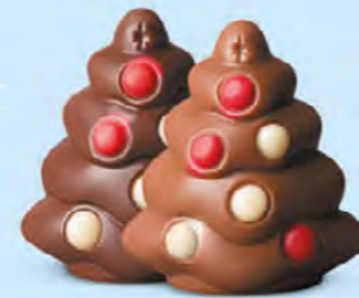
Praliné et sucre pétillant ou praliné et éclats de nougat

Nos choco'pralinés font partie de la magie de Noël. Ils plaisent aux petits... comme aux grands !